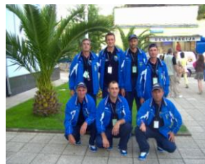
4. mjesto na svijetu 2007. na SP prvenstvu klubova UGSR "Jelah-Tešanj"