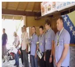
USR „Krušnica“ 2.mjesto 2009 i prvo mjestu 2013 na JPK u mušičarenju