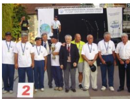
2.mjesto SP-rep.BiH-2013 (reprezentacija veterana)