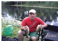
Plovak KUP- Čapljina