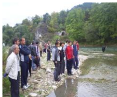
Fly Fishing KONJIC