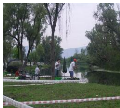
Suorganizatori SP 2007, 2013 Čapljina i EP 2010 Jajce i Ključ