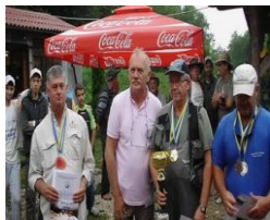
Fly Fishing Busovača