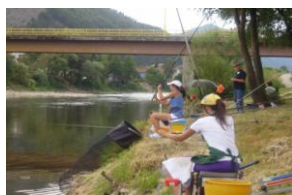
Takmičenje juniora u plovku