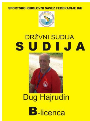
100 x 140 mm