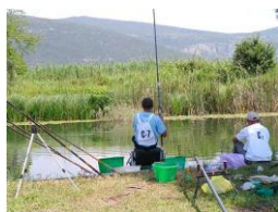
Takmičenje seniora u plovku