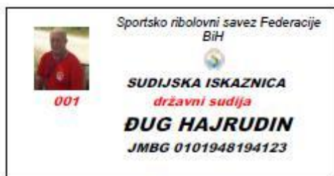
55 x 90 mm

Izgled akreditaciju za međunarodne sudije definisat će sudijska komisija SRS BIH (sudijsko koordinaciono tijelo). Akreditacije imaju još nosač akreditacije (od platna) sa kopčom.