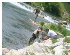
Fly Fishing VITEZ