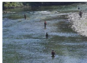
JPK u mušičarenju 2009,2012 2012,2013,K.Vakuf,B.Krupa,Konjic