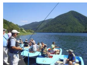
Fly Fishing Plivsko jezero