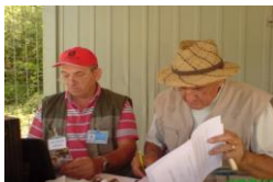
KUP F BiH - V.Kladuša