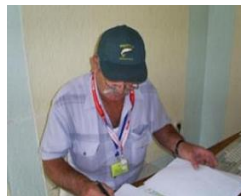
Fly Fishing Donji Vakuf