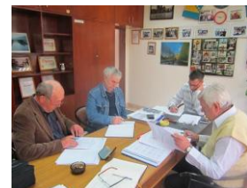
Takmičarska i sudijska komisija SRS F BiH