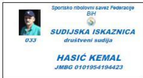
55mm x 90 mm